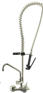
PA66 und komplett