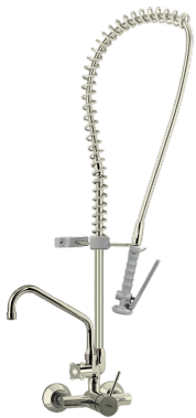
PA66 und komplett