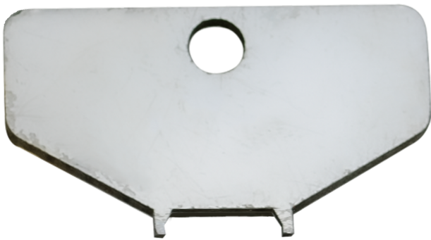
Nockenschlüssel für Schraube zu Umbau-Set X29.121.001 + 2